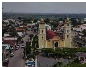
Parroquia San Miguel