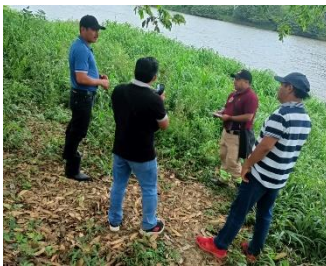
Playa de San Lorenzo Tenochtitlan