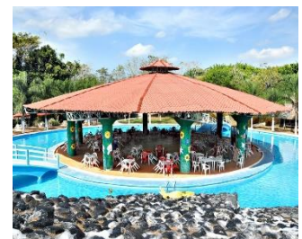
Parque Acuático "La Ceiba"

Cabe destacar que después de las visitas de inspección de zonas concurridas de las diversas localidades y puntos del municipio de Texistepec, los agentes municipales que cuentan con playas han iniciado los trabajos de limpieza y el acondicionamiento de las mismas, para después construir enramadas y delimitar las zonas de riesgo y se está coordinando trabajos con otros puntos turísticos para coordinarse en materia de Protección Civil.