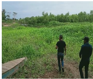
Playa de Boca Del Rio