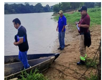
Playa de Paso Los Indios