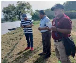
Playa de Pino Suarez