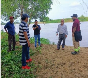
Playa de Loma Bonita

A finales del mes de febrero, la Unidad Municipal de Protección Civil recorrió las 6 playas con mayor afluencia que visitan los turistas año con año durante la temporada vacacional de semana Santa, las cuales son Ixtepec, Boca Del Rio, San Lorenzo Tenochtitlan, Loma Bonita, Paso Los Indios y Pino Suarez. También se visitó las instalaciones del parque acuático "La Ceiba" y se verificó la edificación de la parroquia de San Miguel Arcángel. A continuación, se muestran imágenes de las inspecciones de zonas de riesgos de los lugares turísticos.