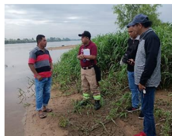
Playa de Ixtepec